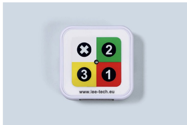
EC-14CB - Viertaster Funksender

Maße: 8,4 x 8,4 x 5,5 cm Gehäuse. Kabel ca. 170 cm