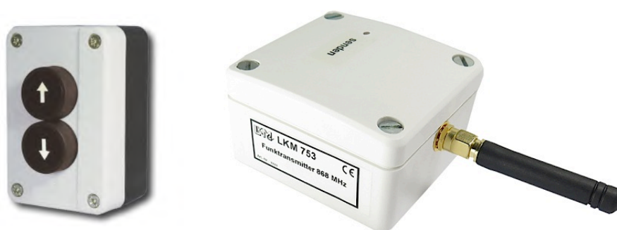
Beispiel: Tastereinheit mit LKM763/IO Funk-System

Auch bei sich drehenden oder bewegenden Teilen ist eine kabellose Übermittlung von Vorteil.